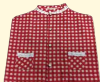
小さいポケット付