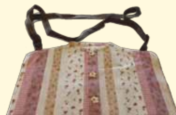
紐付きポシェット式