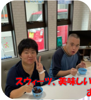
スイーツ、美味しい