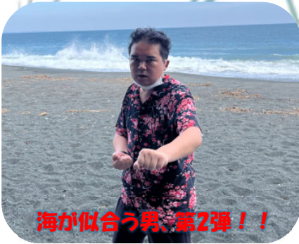
海が似合う男、第2弾!!